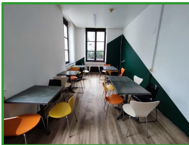
Een dagopvangcentrum voor mensen in kwetsbare situaties

Bij Ons verenigt dak- en thuislozen en mensen in kwetsbare omstandigheden en ondersteunt hen bij hun traject van sociale re-integratie en emancipatie. We zijn een zelforganisatie waar vrijwilligers uit de eigen doelgroep de werking mee dragen en bepalen en zijn daarvoor erkend als ‘vereniging waar armen het woord nemen’. Ons centrum is gewoonlijk gevestigd in de Kartuizersstraat 60, maar sinds begin maart 2024 zijn we tijdelijk verhuisd naar de gebouwen van de Grand Hospice in de Grootgodshuisstraat 7 omwille van ingrijpende renovatiewerken in de Kartuizersstraat.